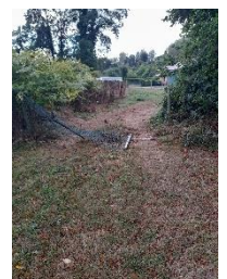
Barrière et clôture dégradées accès Chemin Vert

Depuis plusieurs mois, la commune connaît de nombreuses incivilités impactant sur la sécurité et le bien-être des habitants. N'hésitez pas à nous signaler toutes dégradations que vous constatez sur le territoire.