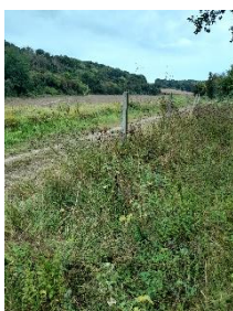
25 m de grillage dérobé au camping