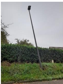
Lampadaire accroché LITTEVILLE