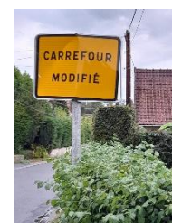
Panneau cabossé rue Sang-Roy